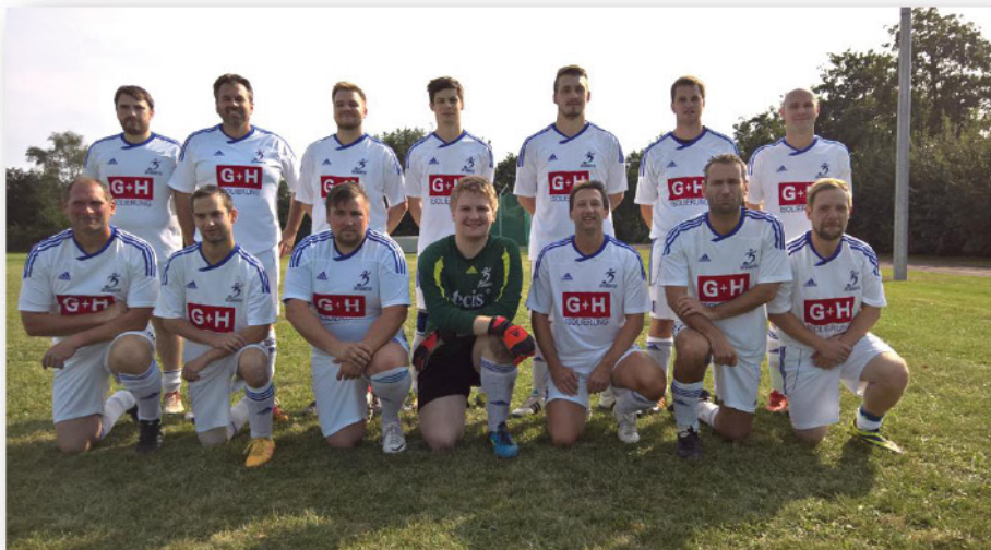
5 Debütanten auf dem Foto

Vielen Dank an die Akteure, die sich bereit erklärt haben, bei der Vierten auszuhelfen.