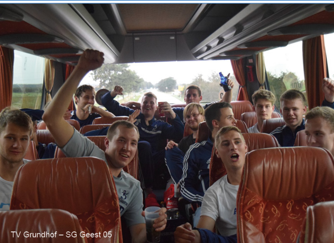
TV Grundhof – SG Geest 05

SG Geest 05 – TSV Großsolt-Freienwill Anstoß: 15.00 Uhr in Krumstedt