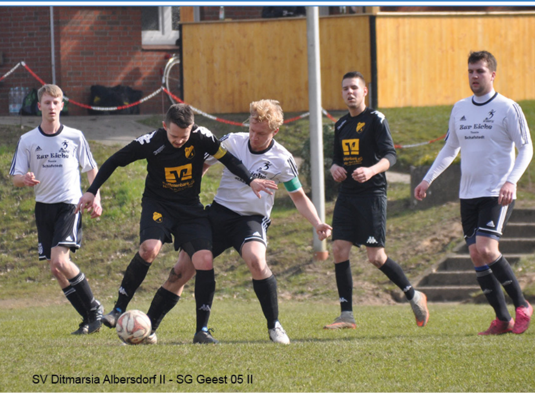
SV Ditmarsia Albersdorf II - SG Geest 05 II