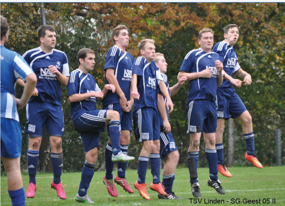
TSV Linden - SG Geest 05 II