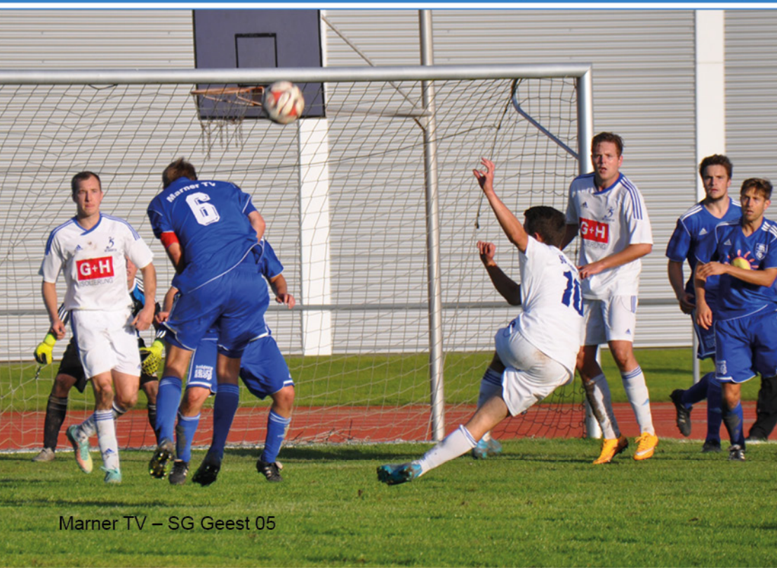
Marnier TV – SG Geest 05